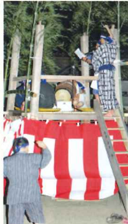
盆踊りには浴衣と甚平が似合う

今年度も開催できるかどうかかわかりませんがこの様な状況だからこそ盛大に又楽しく出来ればと願っています。その時は皆様にはご協力宜しくお願い致します。