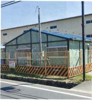
大宮売神社松縄手横の現地事務所