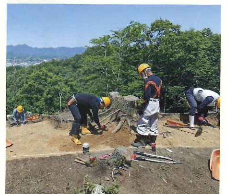
入道峠山上の現場。遠くに西山のテレビ塔が見える