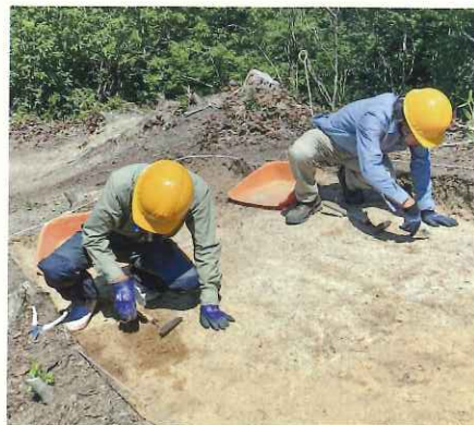
丁寧に手作業で進められています