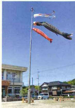
青空に泳ぐ鯉のぼり