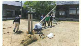
公民館前広場鯉のぼり竿建て