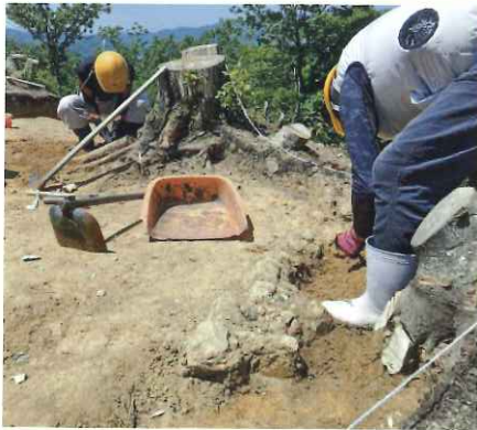
出土した石も人が並べたものか確認しながら進める、とのこと