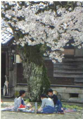
桜満開子ども花見