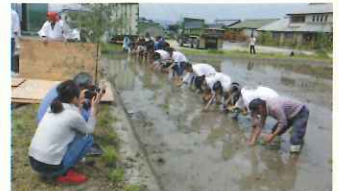
北野天満宮とのお田植え祭