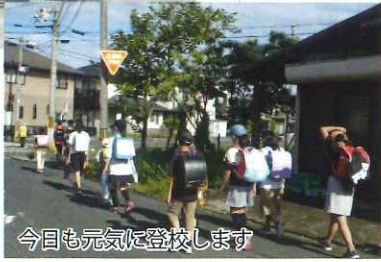
今日も元気に登校します