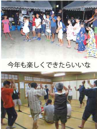
今年も楽しくできたらいいな