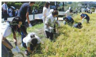
北野天満宮との抜穂祭